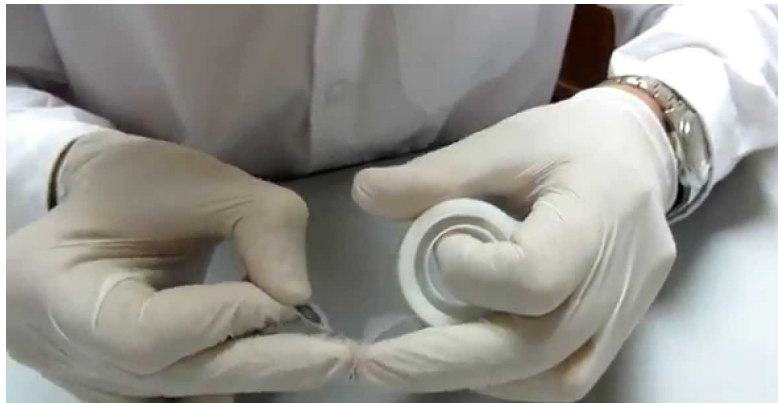
Figura 2. Procedimiento físico para la obtención de grafeno, a partir de la delaminación del grafito

De este modo se consigue grafeno de alta calidad mediante un método sencillo y barato, si bien tiene la desventaja de que es un proceso muy lento y de bajo rendimiento, a la vez que costoso en cuanto a mano de obra y tiempo requerido para obtener una cantidad mínima de grafeno, por lo que no resulta un procedimiento apto para su uso industrial.